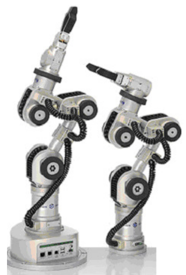
Der Katana-Roboter von Neuronics AG ist mit 6 Harmonic Drive Präzisionsgetrieben ausgerüstet. Weitere Informationen unter www.neuronics.ch

einer Reduzierung des Gewichts um durchschnittlich 35 Prozent ergibt sich eine Reduktion des Robotergewichts um 3,6 kg oder dem Äquivalent von neun Getrie- ben. Zusätzlich können wegen der reduzierten Massen und Mas- senträgheitsmomente kleinere und leichtere Motoren eingesetzt werden, wodurch die Reduk- tion des Robotergewichts noch größer wird. Das genannte Bei- spiel zeigt anschaulich den Effekt, den die Optimierung einer ein- zigen Eigenschaft einer Kom- ponente auf ein Gesamtsystem haben kann.