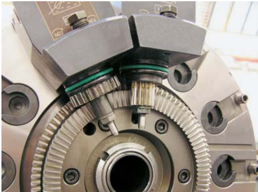
Zwölfach-Revolver von Traub: Zwei Kronenräder treiben die Werkzeuge mit unterschiedlichen Drehzahlen an.

Kronenräder kommen seit Jahren in der Industrie zum Einsatz. Insbesondere macht man sich im Bereich Werkzeugmaschinen die Vorteile dieser Technologie zum Nutzen. Axiale Freiheit vom Ritzel, Achswinkel unterschiedlich von 90°, mehrfacher An- und Abtrieb sowie große Übersetzungen in einer Stufe sind einige Merkmale, die einzeln schon eine positive Wirkung haben und kombiniert einen synergetischen Effekt erzeugen.