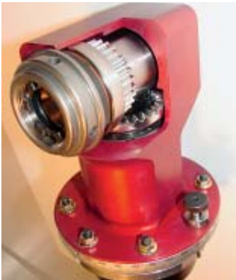
Bohraggregat mit 90°-Winkelkopf: Innerhalb von drei Baugrößen kann der Kunde jeden beliebigen Achs- winkel zwischen 1° und 90° wählen

zellente Laufgüte durch neuartiges Getriebekonzept und verbessertes Geräuschverhalten". Neben diesem Standardprogramm werden auch Sonderlösungen angeboten. Innerhalb von drei Baugrößen kann der Endkunde jeden beliebigen Achswinkel zwischen 1° und 90° wählen. Durch ein intelligentes Logistiksystem kann ASS daraufhin innerhalb von vier Wochen die Fertigteile liefern.