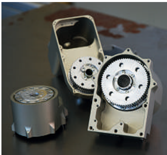
Robotergelenk mit Kabeldurchführung durch das Zentrum des Harmonic-Drive-Getriebes.

Für Chirurgen wird die Präzisionsmechanik immer wichtiger, denn sie erlaubt es heute, bewegte mechanische Geräte zu entwickeln, mit denen komplizierte und heikle Eingriffe am Menschen präziser und weniger invasiv umgesetzt werden können. Ein Beispiel dafür ist die Anwendung computer- und robotergesteuerter Verfahren in der mikrochirurgischen Hörgeräteimplantation.